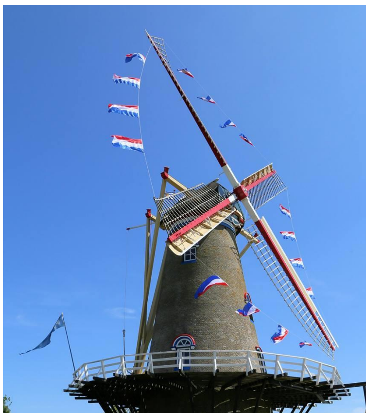
Molendag, genoeg wind voor de vlaggen uit maar niet om te draaien.