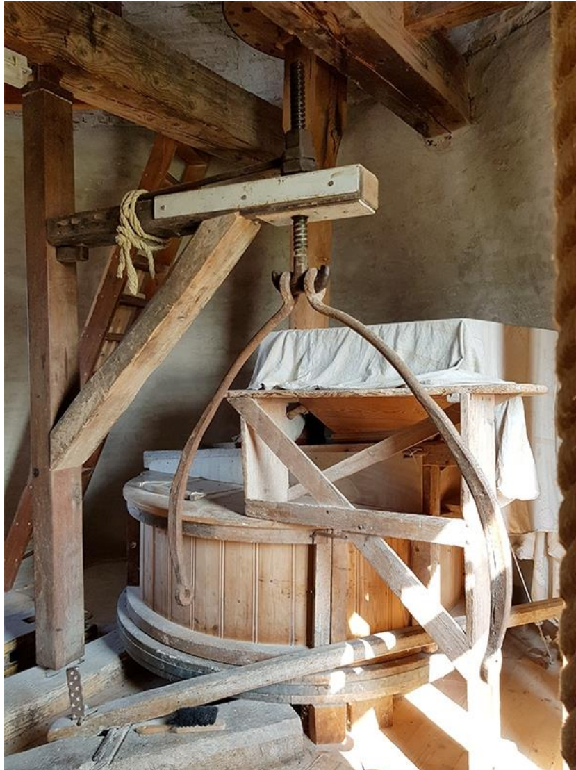
Maalkoppel, met kunststenen.

Op dit moment maakt de stichting gebruik van het hostingpakket van de molenwinkel. Deze heeft voldoende dataruimte om beide websites daarop te laten draaien. De stichting betaald op dit moment alleen voor haar eigen domeinnaam.